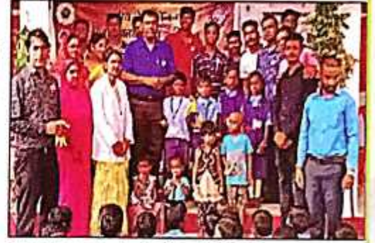
वितरसपुर। जागरूकता कार्यक्रम में शामिल रासेयो के विद्यार्थी।

पोषण अहार एवं कुपोषण जागरूकता अभियान के तहत कुपोषित बच्चों व स्कूल के छात्र-छात्राओं और गर्भवती महिलाओं को पौष्टिक फल वितरण किया गया। साथ ही गर्भवती महिलाओं व छोटे बच्चों का वजन-ऊंचाई मापन भी किया। इस दौरान चार कुपोषित बच्चे पाए गए। उनकी समय-समय पर जांच कर उचित सलाह देने की