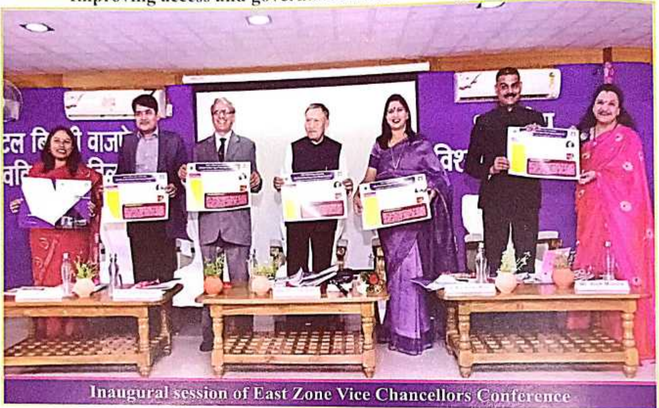
Inaugural session of East Zone Vice Chancellors Conference

"Improving access and governance reforms in higher education"