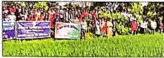
शारदाजी की संस्था-राजस्थान

शारदाजी की संस्था-राजस्थान शास्त्रीय कृषि विज्ञान केंद्रों की सहायता से किसानों को 1500 से अधिक की संख्या में जीव-जंतुओं की मदद से कृषि कार्य में मदद के लिए प्रशिक्षण प्रदान किया जा रहा है। इस कार्यक्रम में शामिल किसानों को प्रशिक्षण के दौरान ही जीव-जंतुओं की मदद से कृषि कार्य में मदद के लिए प्रशिक्षण प्रदान किया जा रहा है।