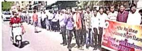
वित्तपुर: अटल मुनिरावरी के छात्रों ने यवन शुंखला बनकर प्लास्टिक कचरे के तबे भंगों को जागरूक किया।

शुंखला बना, धैले बांटरक लोगों को जागरूक किए छात्र