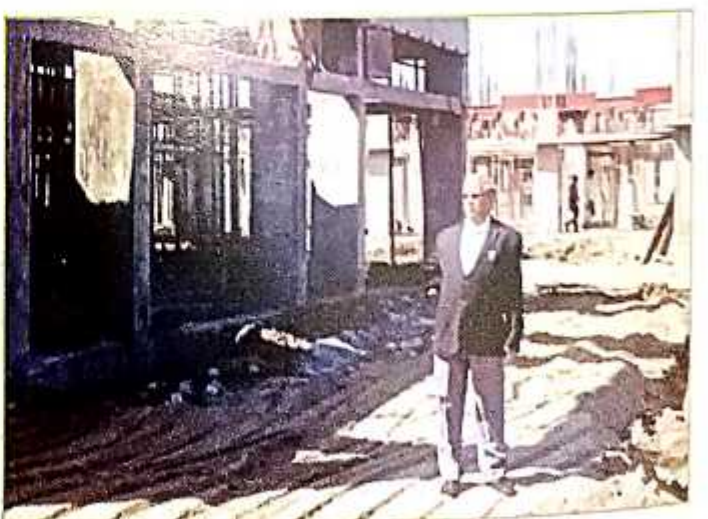
Progress of University building construction under the RUSA