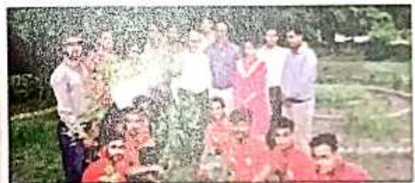
बिलासपुर | कुलपति के साथ अटल बिजली में प्रतियोगिता।