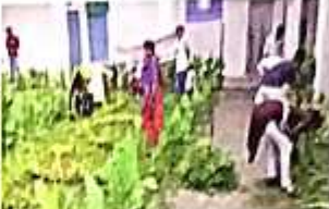
मशरूम का खेती करने की सीख रहे हैं एनएसएस कैडेट्स

एनएसएस कैडेट्स को मशरूम उत्पादन के बारे में प्रशिक्षण दिया गया है। इस कार्यक्रम में शामिल कैडेट्स को मशरूम उत्पादन के बारे में प्रशिक्षण प्रदान किया जा रहा है।