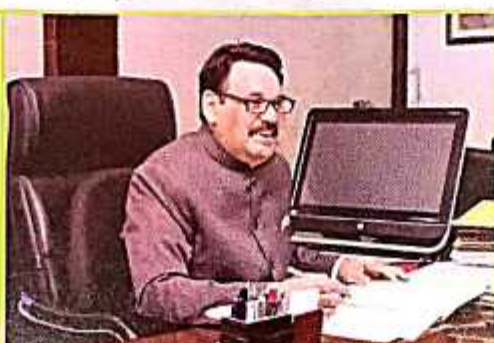
Dr. J.B. Nadda,