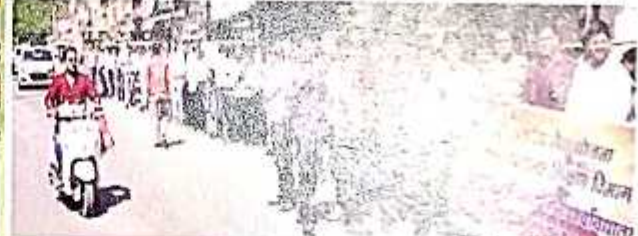
विलासपुर। अटल युनिवर्सिटी के छात्रों ने मानव श्रृंखला बनाकर भव्यतापूर्वक रूप से गांधी चौक से डी.पी. विप्र महाविद्यालय तक जागरूक किया।